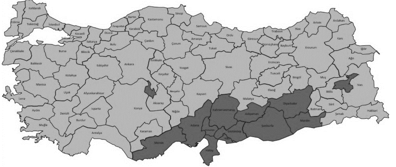
Tablo 1: İllere ve Toplam Nüfusa Oranlarına Göre Mülteciler

This project is funded by the European Union. Bu proje Avrupa Birliđi tarafından finanse edilmektedir. هذا المشروع تم تمويله من قبل الاتحاد الأوروبي