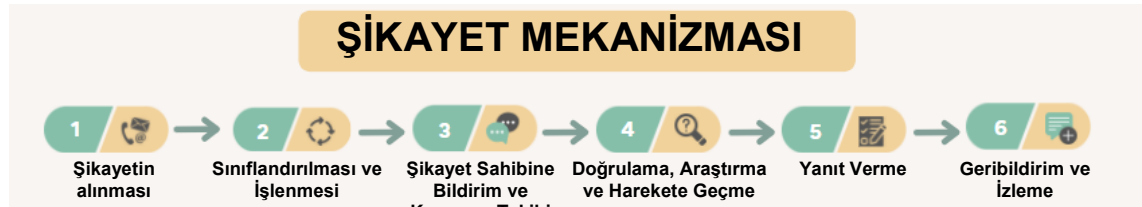
Őekil 3. Őikayet Mekanizması Operasyonel AkıŐı

Őekil 3'te, proje paydaŐlarına yönelik Őikayet Mekanizmasının operasyonel akıŐı gösterilmektedir.